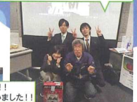
チーム仲いいで賞をとったみなさま♡