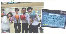
チーム松木のみなさん★